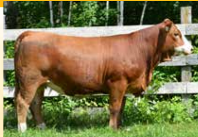
FULL SISTER - FGA 001K