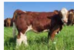
SUMMER 607K AT 6 MONTHS