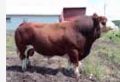
HEMA POL MIKE 7F