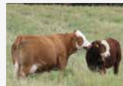
DAM WITH MATERNAL BROTHER

We had full intentions of retaining 69K. Being the 10th anniversary for the Eastern Harvest Sale and debuting Density's first progeny, 69K had to be in Chénéville. We are excited for Density's first daughters to calve this year. Given the production record of his dam, we're confident they will develop into productive females. That consistency also holds true on the bottom side of 69K's pedigree, as her dam has already produced an Eastern Harvest female selling to Lacombe's Farm, and a full brother